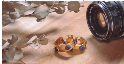
Boucles d'oreilles créoles couleur or et sodalite

Quelles sont les pierres à ne pas associer ? Les lithothérapeutes déconseillent de porter des pierres aux énergies contraires. L'association tourmaline noire et sodalite, par exemple, est à proscrire.