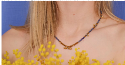
Collier et bracelet avec perles rondes sodalite, mini rondelles hématite et breloques