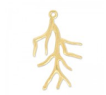
Pendentif corail 38 mm Doré à l'or fin x1 Réf. : PDT-787 Quantité : 1