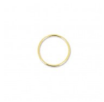
Cercle nu en laiton pour attrape rêves suspension et abat-jour 5 cm Réf. : TOOL-609 Quantité : 1