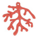
Pendentif corail 37 mm - Terracotta x1 Réf. : PEND-897 Quantité : 1