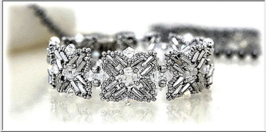
Piros® Argentees Silver