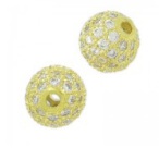
Ronde strassée 8 mm doré/Crystal x1 Réf. : MTL-857 Quantité : 2