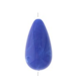
Perle poire en résine opaque 26x14 mm - Bleu royal marbré x1 Réf. : STQ-080 Quantité : 2