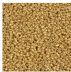
Rocaille Miyuki Duracoat 15/0 4202 - Galvanized Gold x8g Réf. : MR15/4202 Quantité : 1