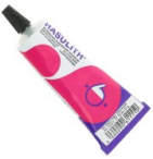
Colle à Bijoux Hasulith 30 ml Réf. : OUTIL-007 Quantité : 1