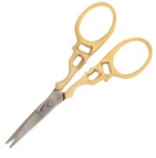
Ciseaux de broderie travaillé 9 cm by Perles&Co - Doré x1 Réf. : COU-610 Quantité : 1