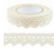
ruban adhésif de dentelle

Retrouvez tout le matériel sur PERLES & CO ★