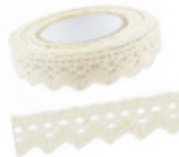
ruban de dentelle adhésive