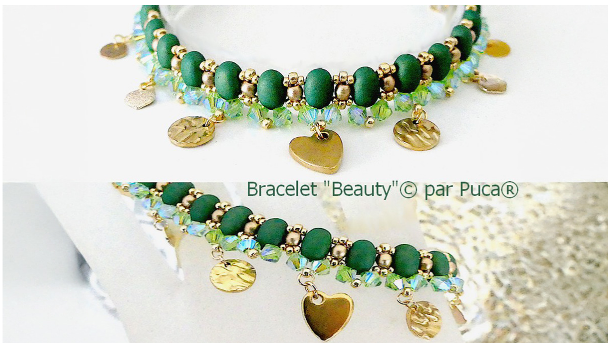
Bracelet "Beauty" © par Puca®