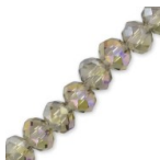
Perles rondelles facettées - rondes aplaties -4x3 mm Black Diamond AB x43cm Réf. : RVC-275 Quantité : 1