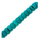
Perles Rondelles Heishi 4.3 mm imitation Turquoise x39cm Réf. : SP-374 Quantité : 1