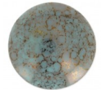
Cabochon rond en verre par Puca® 25 mm Opaque Aqua Luster Bronze x 1 Réf. : TCHE-485 Quantité : 1