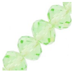
Perles rondelles facettées - rondes aplaties -8x6 mm Peridot x40cm Réf. : RVC-568 Quantité : 1